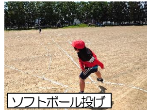
ソフトボール投げ

2年生以上は、昨年の結果と比べて、自分の体力の伸びを感じることができます。この体力測定を機に、自分の体力に関心を持ち、進んで運動に取り組んでほしいと思います。個人の記録は、一覧表にしてお知らせします。