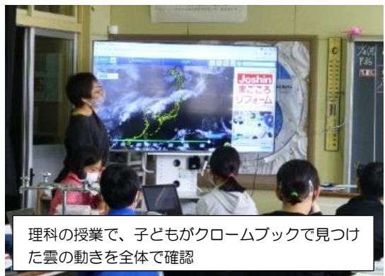
理科の授業で、子どもがクロームブックで見つけた雲の動きを全体で確認