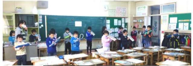
2年生の鍵盤ハーモニカグループ

なお、当日の発表の様子(映像)は、何らかの形で配信することも検討しています。詳細は、後日お知らせします。