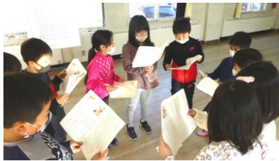
2年生の音読劇グループ