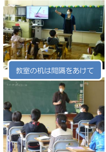
教室の机は間隔をあけて

学校の “新しい生活様式” が身に付くまでには時間がかかりそうですが、「感染症予防」を第一にしていく生活が長く続くと思うと、ご家庭と協力し、意識して取り組んでいかなくてははいけません。