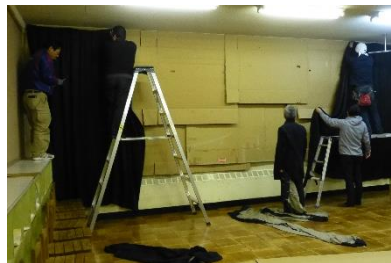
北栄子ども祭りのおひげ屋敷と同じく教室を真っ暗にさせていただきました

前日の夜には、おやし俱樂部や元気クラブの方々にも、おひげ屋敷さんからの教室環境を整えていただきました。