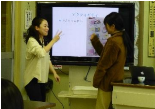
石川先生とのアクティビティは、もりあがりましたよ

今回講師を務めてくださったのは、昨年まで本校に勤務していた〇〇先生です。現在、音更町内3校の小学校で外国語専科として活躍されています。〇〇先生からは、すぐにも授業で生かせるようなたくさんのヒントをいただくことができました。