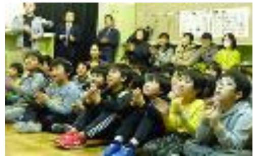
みんなで『パネルシアターのうた』を歌って いよいよ本番

前日の夜には、おやし俱樂部や元気クラブの方々にも、おひげ屋敷さんからの教室環境を整えていただきました。