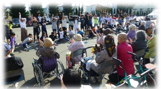
大きな拍手をもらう5年生の子ども達

このような取組は、子ども達の自己有用感を高めることにもつながる貴重な体験の一つと考えています。