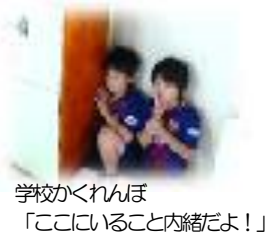
学校かくれんぼ 「ここにいること内緒だよ!」

先日の選挙での公約を聞いていると、どの子どもも北栄小学校をもっと笑顔あふれる楽しい学校にしたいと思っていることが伝わってきました。