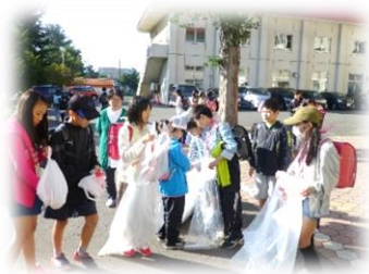
地域をきれいに「クリーン作戦」

そんな学校になるよう、今までも児童会三役や代議員をはじめ各専門委員会では様々な取組を行ってきました。先日は、広い校舎内を使って「学校かくれんぼ」をしました。普段はなかなかできないことを企画して、皆で楽しんでいました。