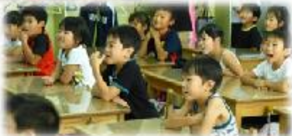
この笑顔と集中力、英語を楽しんでいます